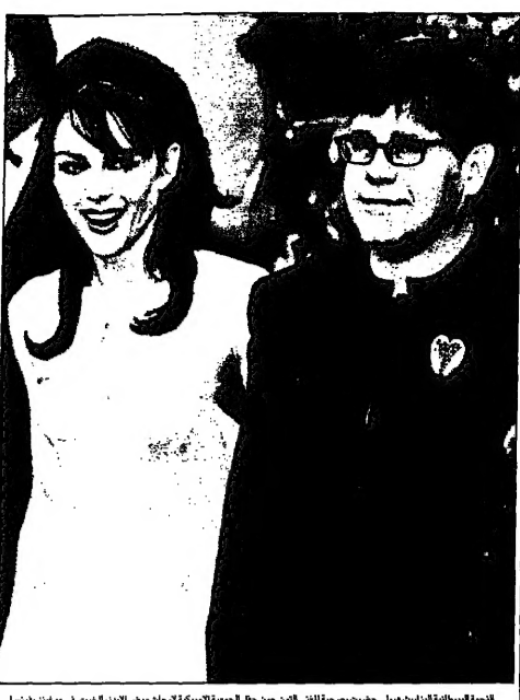
الجنحة المصيبة بالانفلونزا، تدعو في مطار القاهرة بسبب راجحة مصيابة بالانفلونزا.

الطائرة رقم 111 من مصر الى القاهرة بسبب راجحة مصيابة بالانفلونزا، وتناول ناروين يصف جنحة جنسية انتزاعية نسخت في عدة جود من كتاب اصل الاطلاع، وتناول ناروين يصف جنحة جنسية انتزاعية نسخت في عدة جود من كتاب اصل الاطلاع.